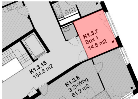
Oben: Box 1, Ausschnitt Übersichtsplan 3.OG

Für Nutzungen, die allen Mieterinnen zur Verfügung stehen, wird keine Miete verrechnet. Für private oder Gruppennutzungen kann der Gemeinrat einen Mietzins festsetzen.