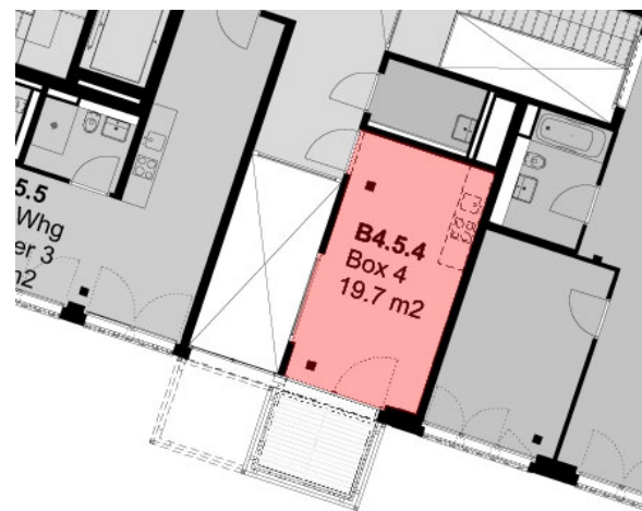
Unten: Box 4, Ausschnitt Übersichtsplan 5.OG