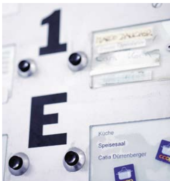
Luxus: Wer hat schon Küche und Speisesaal im Haus?

Auch wenn sich die Grossküche nicht durchsetzen konnte: Die Idee des gemeinsamen Essens bleibt eng mit der Philosophie des genossenschaftlichen Wohnens verbunden. In vielen Baugenossenschaften haben sich entsprechende Traditionen bis heute erhalten. Man denke nur an das klassische Siedlungsfest. In der Siedlung Hedingerfeld der Bahoge in Affoltern am Albis geht dabei nicht nur die Gemeinschaft, sondern auch die Integration durch den Magen: Am inter-