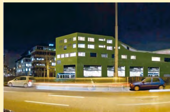
Situationsmodell und Visualisierung des Projekts von Müller Sigrist Architekten AG. Die Farbgebung ist noch offen. Legende Modell: 1 = Badenerstrasse 2 = Kalkbreitestrasse