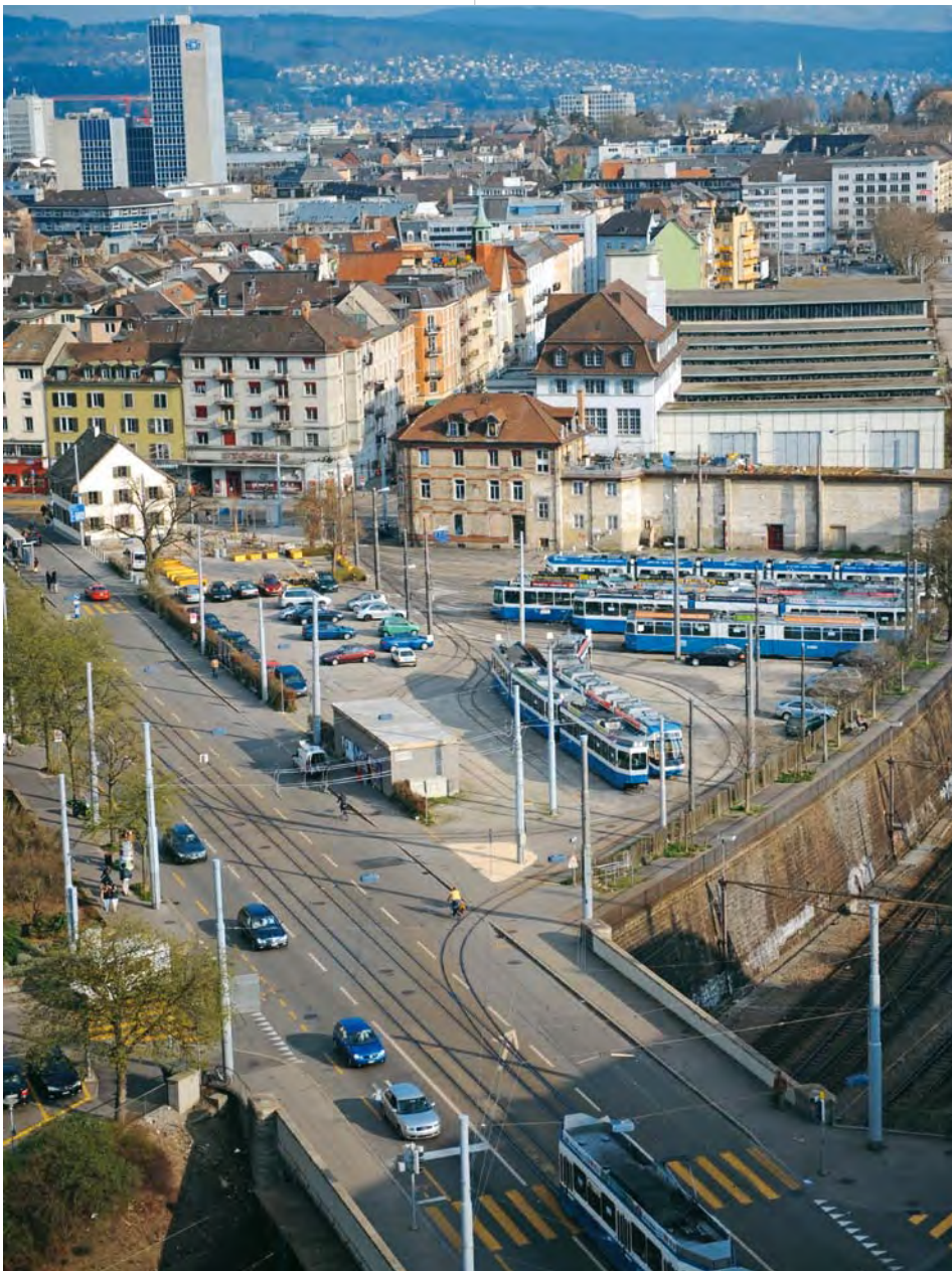
Kalkbreite-Areal: Die zwei Baufelder erstrecken sich zwischen der Badenerstrasse und den Abstellgleisen sowie oberhalb des Tramdepots an der Kalkbreitestrasse (anstelle Backstein-Altbauten). Die Abstellgleise werden überdacht, wodurch die neue Siedlung eine grosse Terrasse erhält. Das ehemalige Restaurant Rosengarten an der Spitze des Dreiecks, das im Besitz der Stadt ist, bleibt erhalten. Die Genossenschaft Kalkbreite betreibt dort einen Quartiertreffpunkt.

schwierig. Sorgt man jedoch dafür, dass grössere Wohnungen tatsächlich von mehreren Personen belegt sind, kommt man relativ einfach auf diesen Schnitt.